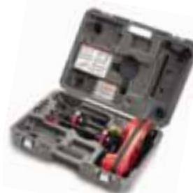
Lokalizator NaviTrack II™ w kasecie do przenoszenia.